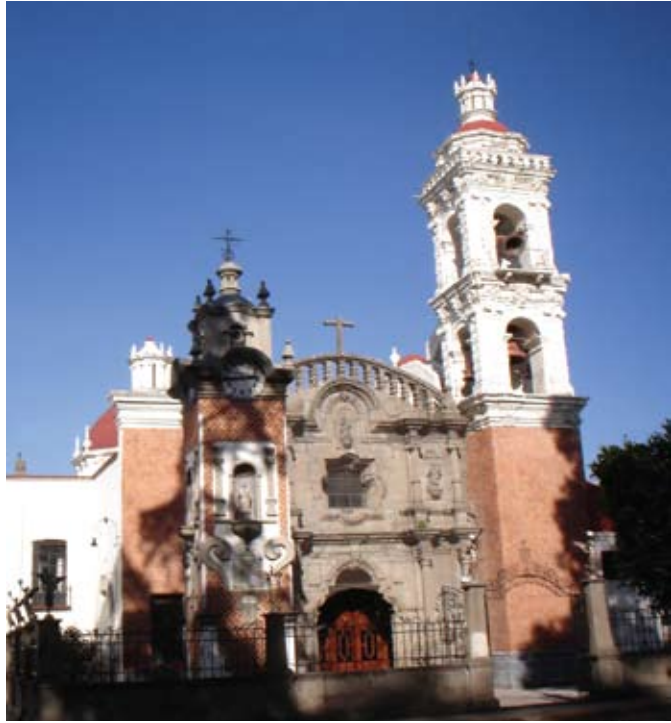
NUESTRA SEÑORA DE SANTA ANA, CHIAUTEMPAN