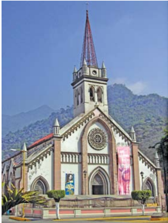
SAGRADO CORAZÓN DE JESÚS, RÍO BLANCO