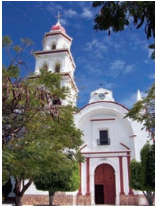
SANTO DOMINGO DE GUZMÁN, TEPEXI DE RODRÍGUEZ