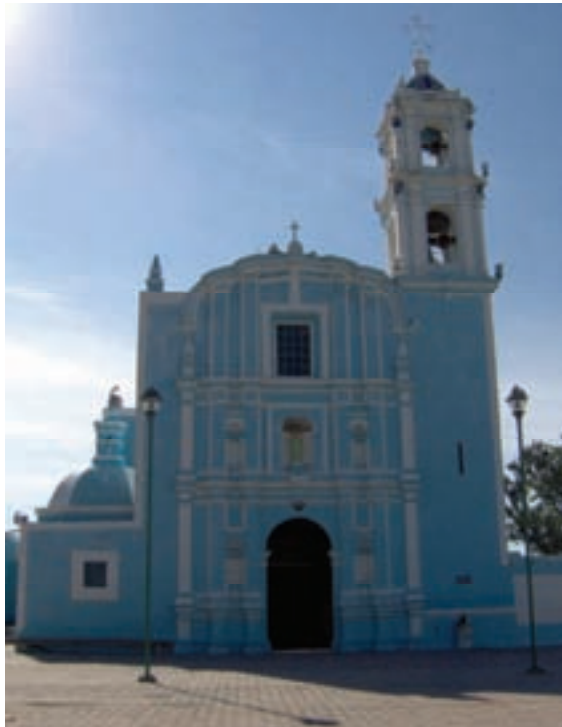
NUESTRA SEÑORA DE LA ASUNCIÓN, MOLCAXAC